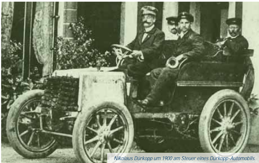
Nikolaus Dürkopp um 1900 am Steuer eines Dürkopp-Automobils.

Der Bielefelder Unternehmer Nikolaus Dürkopp beweist Verantwortung: In seiner Nähmaschinenfabrik Dürkopp & Schmidt gründet er am 4. September 1873 eine betriebseigene Fabrikasse. Er sichert damit als einer der ersten seine Arbeiter gegen den Krankheitsfall ab.